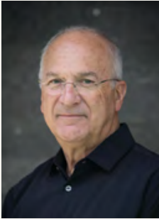
פרופ' דוד ראל נשיא האקדמיה

חברות וחברי האקדמיה, קוראות וקוראים נכבדים,